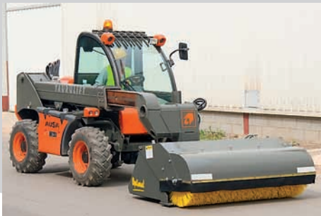
Balayeuse (système Multi-tach)