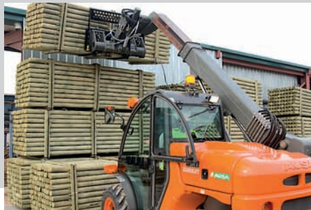
Fourches avec tablier de déplacement latéral (système Multi-tach)