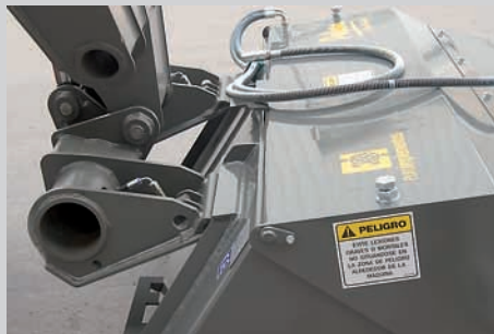
Attache rapide Multi-Tach