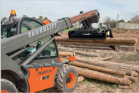
Pelle multi-usage (système Multi-tach)