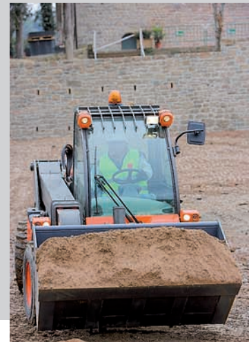
Godet AUSA de 600 l.

TOUT TERRAIN: La transmission 4x4 permanente avec pente max de 45°, la plus grande garde au sol disponible sur le marché (340mm), et les 4 roues égales de grand diamètre permettent une excellente traction, la stabilité de la charge et le passage des obstacles sur des terrains irréguliers et humides..